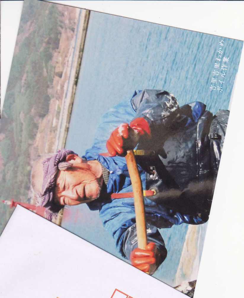
吉里吉里わかめ ボイル作業